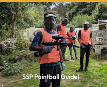
SSP Paintball Guidel