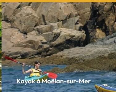
Kayak à Moëlan-sur-Mer