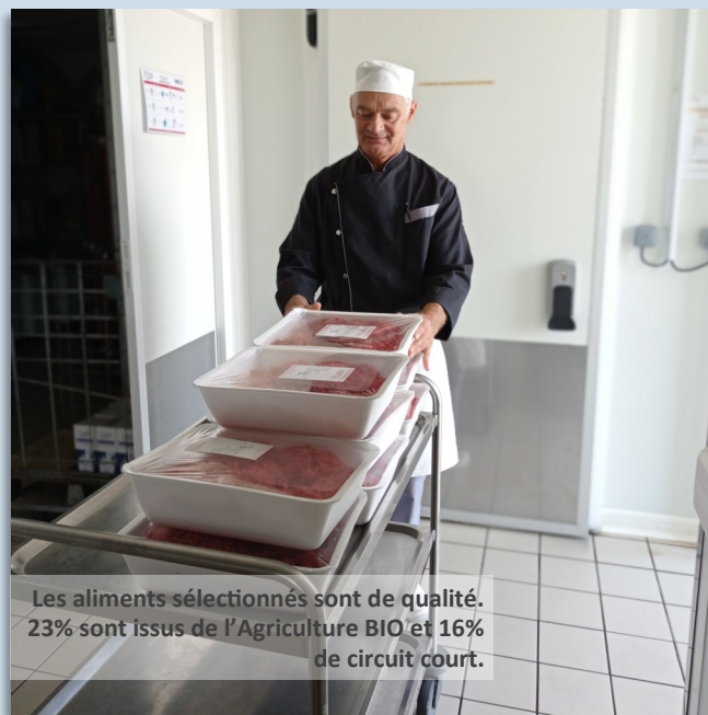
Les aliments sélectionnés sont de qualité. 23% sont issus de l'Agriculture BIO et 16% de circuit court.

12h. Dans l'autre salle, les élémentaires font leur entrée par la cour-sive (édifiée pour sécuriser le trajet de l'école au Restaurant scolaire). Ils passent ensuite « à la rampe » au self. 200 convives défilent.