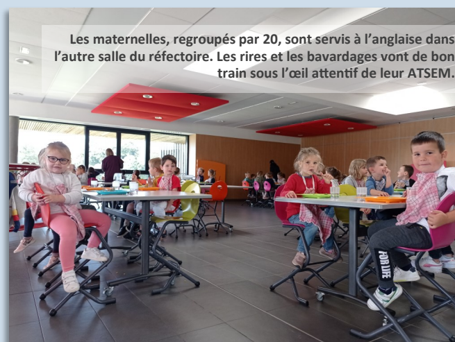
Les maternelles, regroupés par 20, sont servis à l'anglaise dans l'autre salle du réfectoire. Les rires et les bavardages vont de bon train sous l'œil attentif de leur ATSEM.

L'après-midi, Patrice repartira livrer le goûter à la Maison de l'Enfance. Un laitage, un fruit et du pain... Que recevront une centaine d'élèves. Parfois, ils découvrent un petit pain au chocolat ou une part de gâteau.