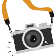
PHOTO ET VIDÉOGRAPHIE BOÎTE À LUMIÈRES

L'association a pour but de recenser et exposer tous les appareils photos depuis des années.