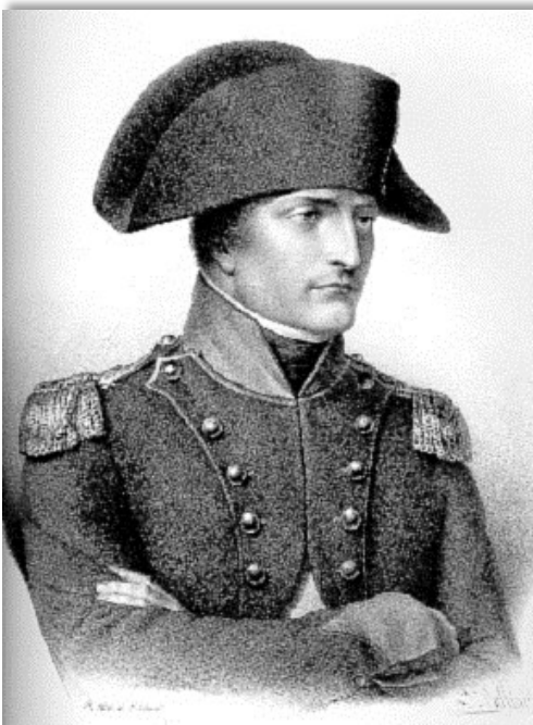
Napoléon BONAPARTE I 1769-1821

Fin d'année 2021, de nouveaux lots ont été acquis sur Saint-Evarzec par des propriétaires privés. Il s'agira de lotissements dits « de pavillons ». Les permis d'aménager ayant été accordés, la viabilisation des terrains est désormais en cours. Un potentiel d'une centaine de logements est attendu. À la demande des lotisseurs et pour l'intérêt que représente la dénomination de voies pour la commune, la mairie s'est employée à rechercher des noms. Le conseil municipal a souhaité conserver les noms historiques des lieux, en s'inspirant des noms des parcelles agricoles répertoriés dans le premier cadastre national. Lancé par Napoléon, il fut terminé pour notre commune en 1840.