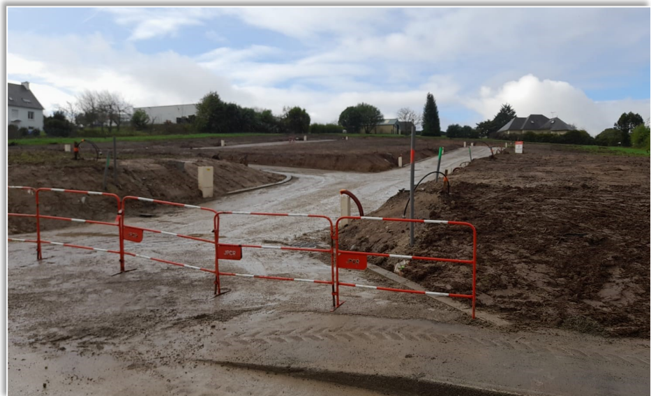
Le lotissement de Keromen en cours de viabilisation

Fin d'année 2021, de nouveaux lots ont été acquis sur Saint-Evarzec par des propriétaires privés. Il s'agira de lotissements dits « de pavillons ». Les permis d'aménager ayant été accordés, la viabilisation des terrains est désormais en cours. Un potentiel d'une centaine de logements est attendu. À la demande des lotisseurs et pour l'intérêt que représente la dénomination de voies pour la commune, la mairie s'est employée à rechercher des noms. Le conseil municipal a souhaité conserver les noms historiques des lieux, en s'inspirant des noms des parcelles agricoles répertoriés dans le premier cadastre national. Lancé par Napoléon, il fut terminé pour notre commune en 1840.