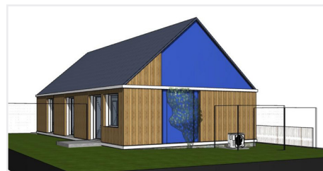
*Dotation d'Equipements des Territoires Ruraux