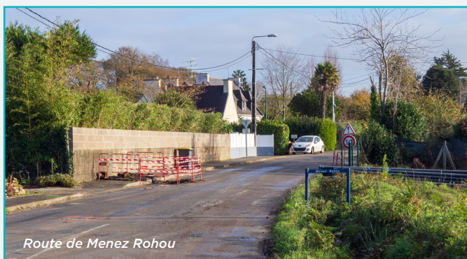
Route de Menez Rohou

Route de Fouesnant, ces aménagements consistent en la création d'une piste cyclable et piétonne, la création de trois arrêts de car, ainsi que des liaisons piétonnes pour les desservir. Au niveau du carrefour de la route de Menez Rohou et de la route de Fouesnant, les travaux prévoient l'aménagement de trottoirs, le réaménagement du « tourne à gauche » ainsi qu'une rénovation de la voirie. Ces travaux incluent également le remplacement du réseau d'eau potable, de l'éclairage public et l'enfouissement des réseaux électriques et télécom en cours sur la route de Menez Rohou. Le coût de cette opération, financée par la communauté de communes, le département et la région, se monte à 1 383 000 € HT.