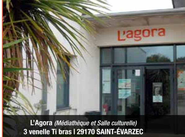
L'Agora (Médiathèque et Salle culturelle) 3 venelle Ti bras | 29170 SAINT-ÉVARZEC

Pour toute demande d'information ou réservation, prenez contact avec la Médiathèque.