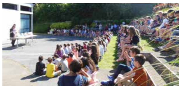
Proclamation prix des incos