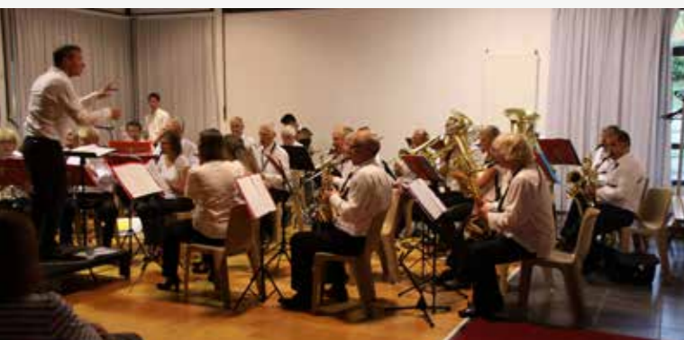
Concert Quimper Harmonie Cornouaille

La médiathèque de l'Agora, animée par une équipe de professionnelles et les bénévoles de « Lire à Saint-Évarzec », est un carrefour culturel pour toutes les générations. Elle permet à chacun de se former, de s'informer et de se distraire, et ce, dès le plus jeune âge en proposant une collection de plus de 10 000 documents.