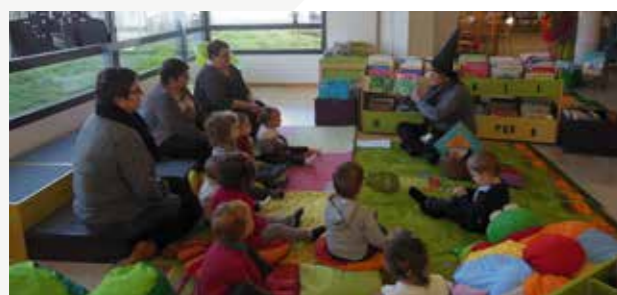
Pomme de reinette et pomme d'api