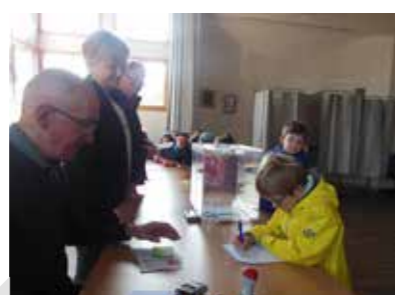
Vote en mairie prix des incos