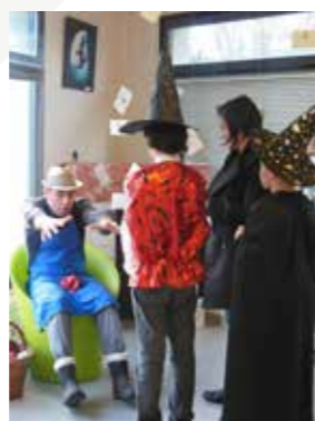
Murder party chez les sorciers