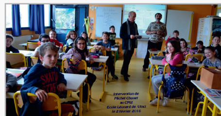
Intervention des bénévoles pour sensibiliser et informer les élèves de CM 2 de l'école Léonard De Vinci.

En cas de l'absence de réception du guide, n'hésitez pas à contacter le service communication au 02 98 56 72 82.