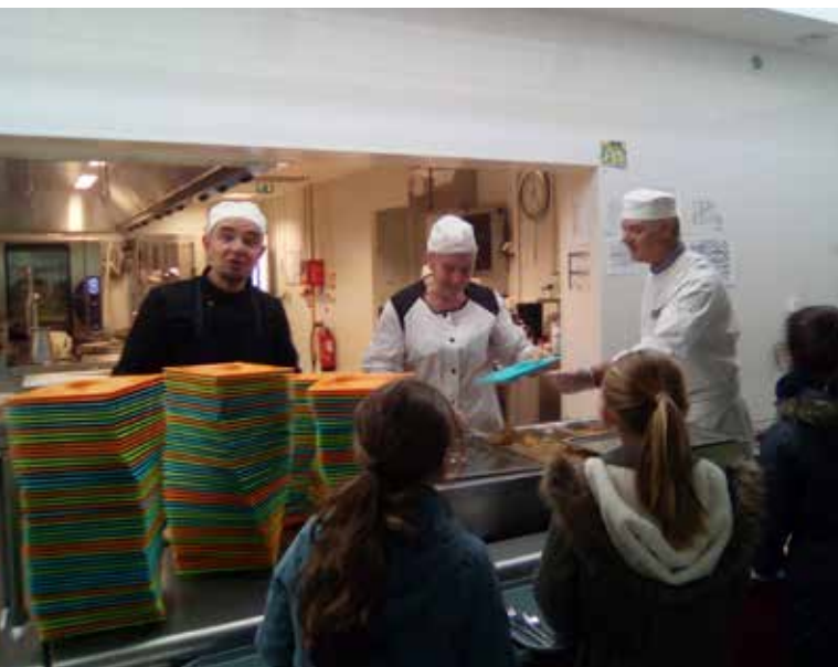
RÉPARTITION DE L'APPROVISIONNEMENT ALIMENTAIRE DU RESTAURANT SCOLAIRE DE SAINT-ÉVARZEC