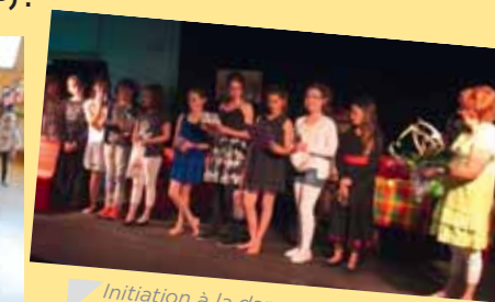
Initiation à la danse africaine et à l'anglais Représentation théâtre