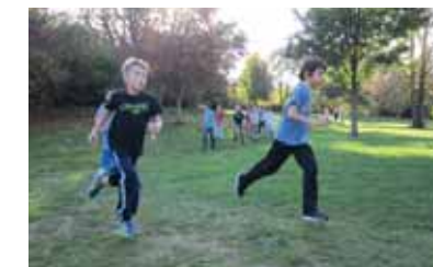
Sortie EPS au Parc de la Fontaine.

Comme tous les ans, de nombreuses activités se déroulant en dehors du cadre traditionnel de l'école sont proposées aux enfants. Cela permet de lier les programmes scolaires (maths, français, littérature, histoire, géographie, sciences, arts visuels ....), qui peuvent paraître détachées de la vie réelle, à quelque chose plus proche des réalités des enfants. Mais cela permet aussi de leur faire découvrir des activités auxquelles ils n'ont pas toujours accès. Cette année, nous avons mis en place, en raison d'une baisse des subventions, des ventes de chocolats et livres pour enfants. Ceci doit nous permettre de maintenir, en 2015-2016, le programme des activités présentées ci-dessous avec quelquefois des aménagements : - Activités culturelles : cinéma, musée des Beaux-arts, rallye littéraire, centre d'art contemporain, danse, rencontres chorales, fréquentation de la médiathèque de l'Agora. - Activités sportives : piscine, escrime, cross des dunes et challenge d'athlétisme.