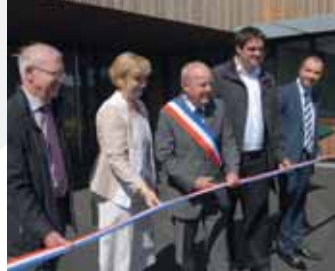
20 juin : Inauguration du restaurant scolaire.