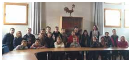
Visite de la Mairie.

L'accueil des élèves se fait en classe le matin et le soir en maternelle mais aussi en primaire. L'école sollicite également les parents pour l'animation de séances en fonction des activités professionnelles (boulangerie, médecine...), d'accompagnement (piscine, bibliothèque...), et petits travaux. L'établissement est aussi le leur.