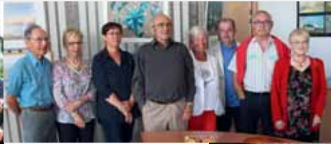
juin : Vernissage de l'exposition Libre Pinceau.