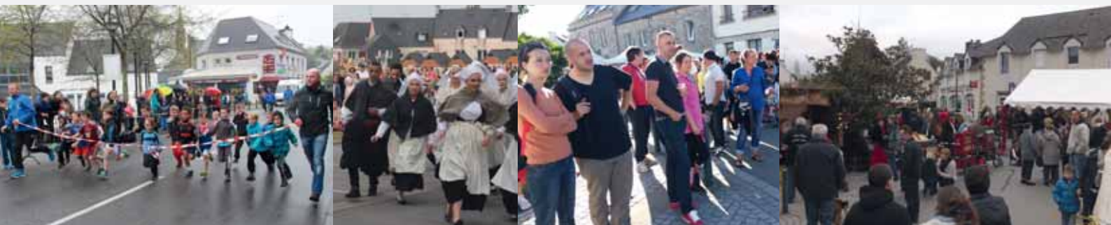
2 Mai : Course communale des Foulées Varzécoises.