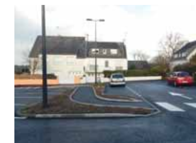
Aménagement du lotissement de Cavardy.

de la banque alimentaire à la maison communale. D'autres travaux sont actuellement en cours sur la commune, sous la maîtrise de la CCPF, comme l'effacement de réseaux Impasse de Ty-Broen ou la réfection du réseau d'eaux pluviales à Croas-an-Intron par le conseil départemental sur la RD 783. Le rond-point, rue Jean Gueguen (face Maréval) dans la zone de Troyalac'h sera également réalisé courant janvier.