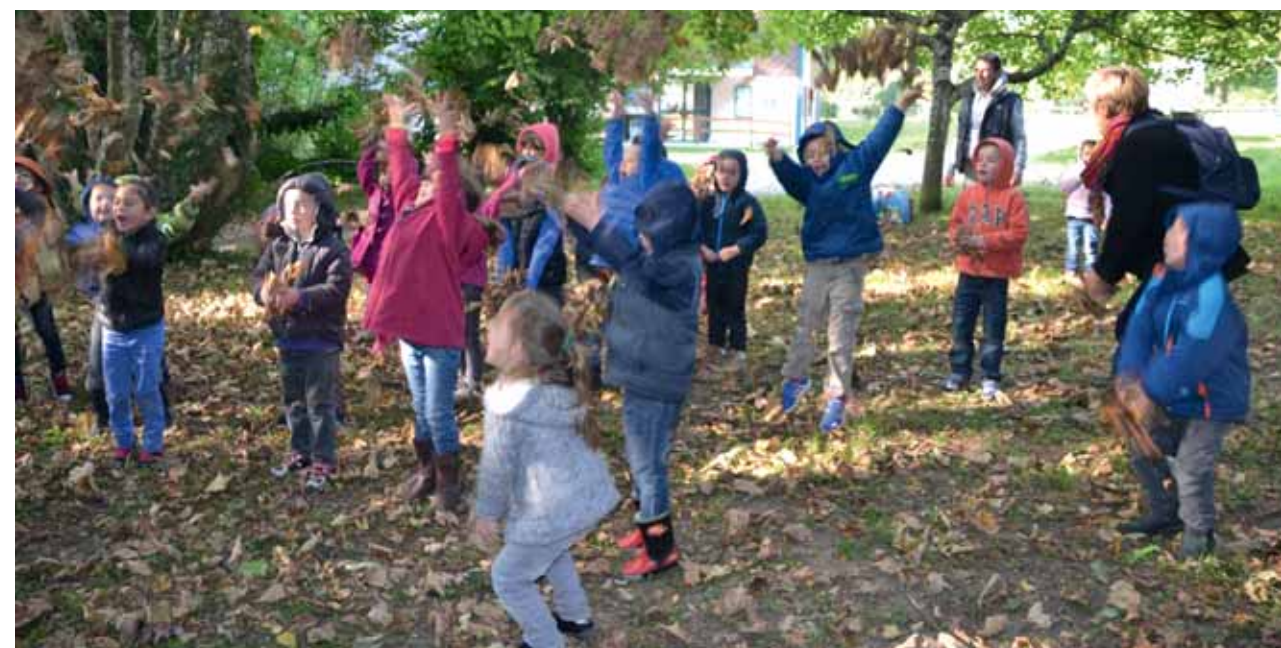
La classe Moyenne grande section à Penfoullic