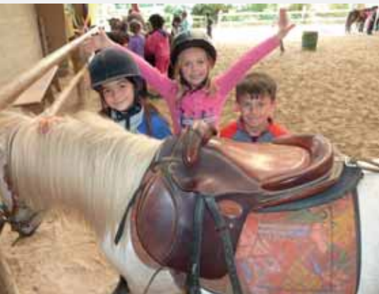
Les Ce1 au Poney Club de Lanveron.