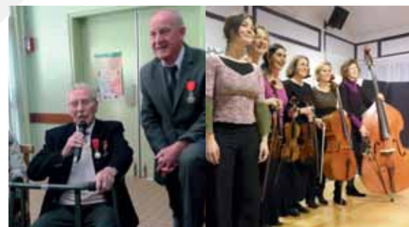
Janvier : Légion d'honneur M. le Maire