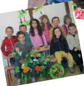
concours du vélo le plus original (Tour du Finistère)