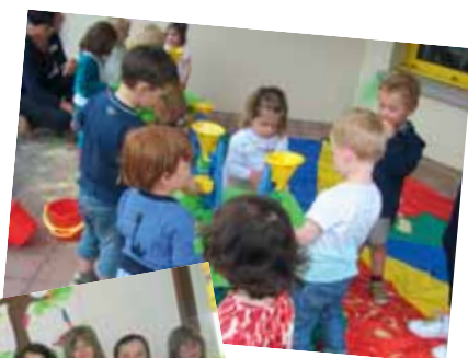
Rencontre autour des jeux sensoriels