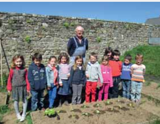
Le potager des maternelles.