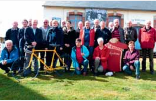
15 avril : Tour du Finistère, les bénévoles sur le pied de guerre.