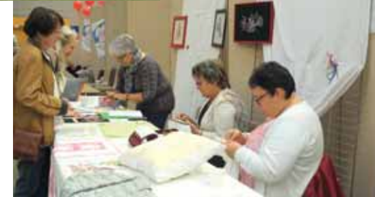
6 Septembre : Forum des associations.