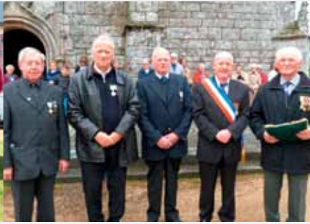
Commémoration du 8 mai.