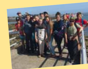
Départ pour l'île de Batz juillet 2015