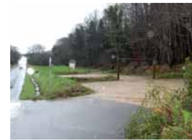
Parking du Bois du Moustoir.

L'entretien des bâtiments publics est permanent et donne satisfaction à tous ses usagers. Dernière réalisation : la création des nouveaux locaux