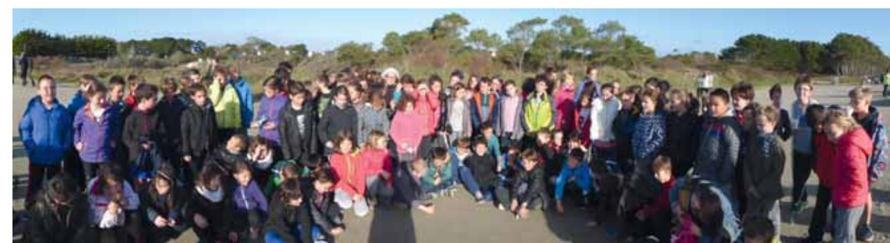
13 Novembre : les classes de CE2-CM1-CM2 au cross des dunes à Moustierlin-Fouesnant.

L'équipe enseignante vous présente ses MEILLEURS VŒUX pour l'année 2016 ! ▲