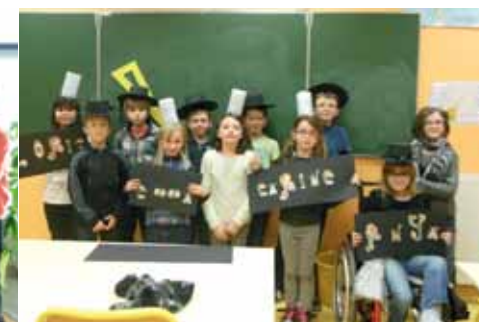
Janvier : TAP, culture bretonne, Médiathèque.