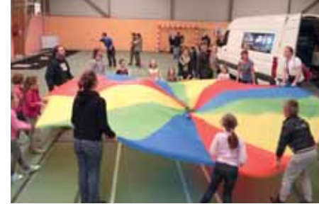
27 juillet : Soirée Projection cinéma Jeux de société et projection l'Age de glace 4.