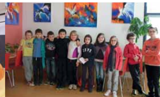
Février : TAP, exposition à la Médiathèque.