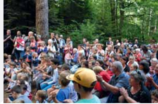
6 juillet : Balade au Bois du Moustoir.