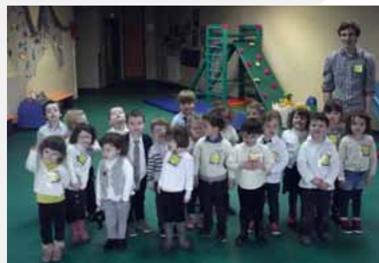
Uniforme et écusson pour chacun lors de la semaine anglaise.

Les élèves ont choisi cette année de participer à l'opération « déchaîne ton cœur ». Leur action a déjà permis de récolter des fonds pour financer le matériel scolaire d'une école malgache. En réponse aux initiatives du CCJ, les classes visitent les différentes manifestations proposées sur la commune (exposition sur la guerre 1914/1918, prix des Incorruptibles...)