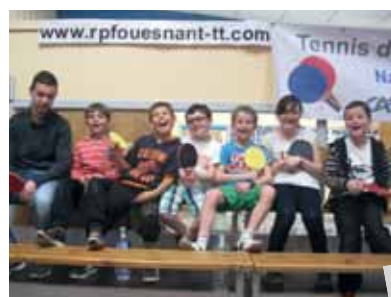
Initiation au gouren Tennis de table Roller et basket