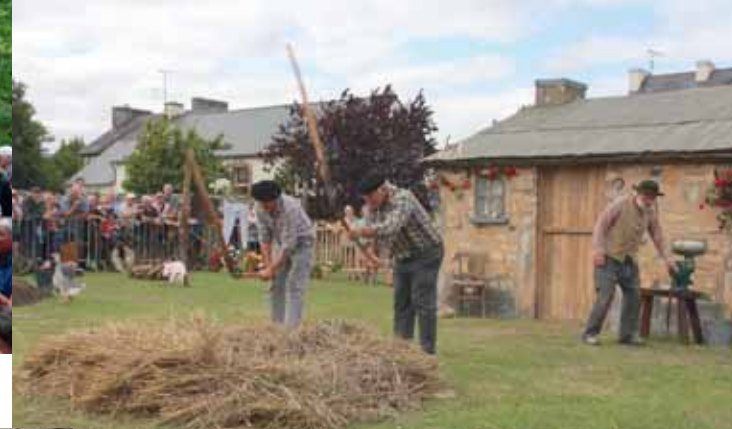
7 Août : Fête de la moisson.