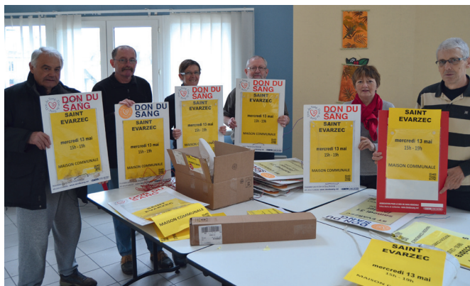
Les bénévoles se mobilisent à chaque collecte pour apposer les banderoles et les affiches aux endroits stratégiques de la commune.

Une suggestion : venez avec un proche qui hésite à venir, parrainez-le, encouragez-le.