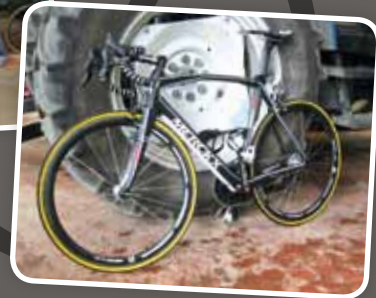
Une roue dans la roue