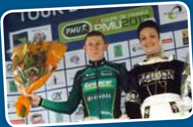
Remise du 1 er prix