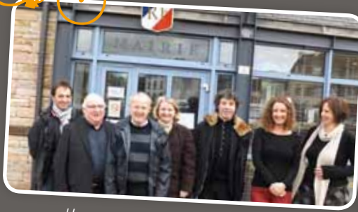
Une reconnaissance avant le Tour