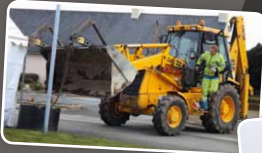
Il a fallu renforcer les structures des barnums à cause des intempéries