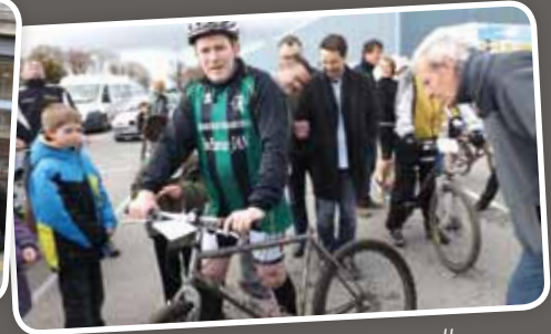
Prix spécial pour une course sans selle...