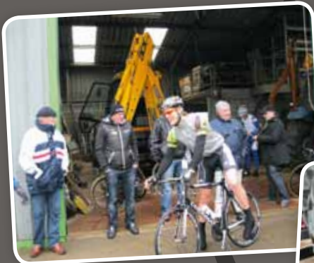
Une équipe belge se réfugie aux services techniques, toute une histoire...